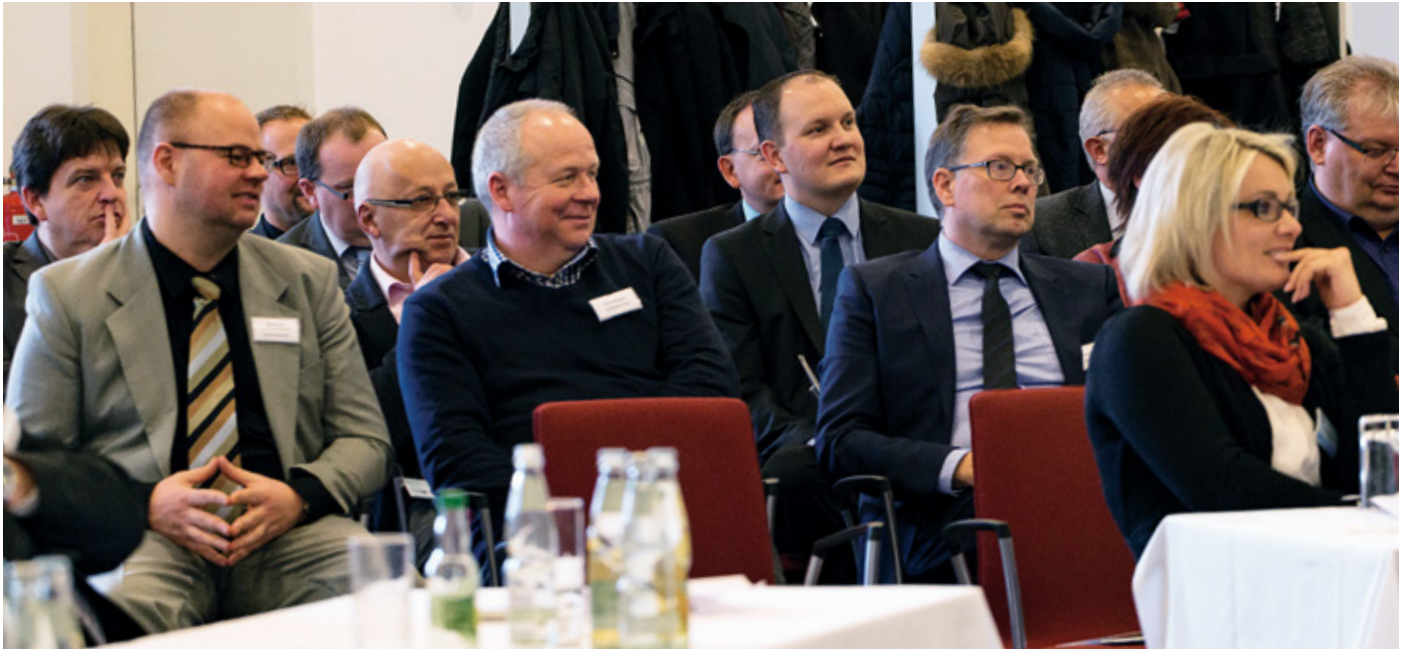
Die neu gewählten Bürgermeister im enviaM-Netzgebiet erhielten einen Einblick in die Unternehmensgruppe.